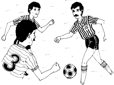
Permainan Bola Sepak.

Kejohanan yang diadakan pada tiap-tiap tahun ini adalah untuk merebut Tropi YTM Tuanku Abdul Rahman Putra Al-Haj, Perdana Menteri Tanah Melayu selaku yang Dipertua Gabungan Bolasepak Asia dan Persatuan Bolasepak Tanah Melayu.