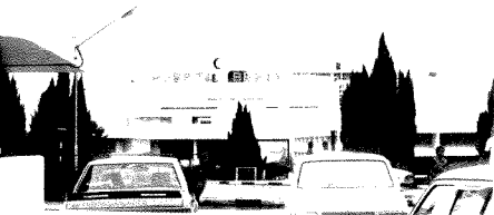
Hospital Besar, Kuala Lumpur.

Pembinaan Hospital Besar Kuala Lumpur ini menelan belanja sebanyak $49 juta – $21 juta bagi peringkat pertama dan kedua manakala $28 juta lagi bagi peringkat ketiga, keempat dan kelima.